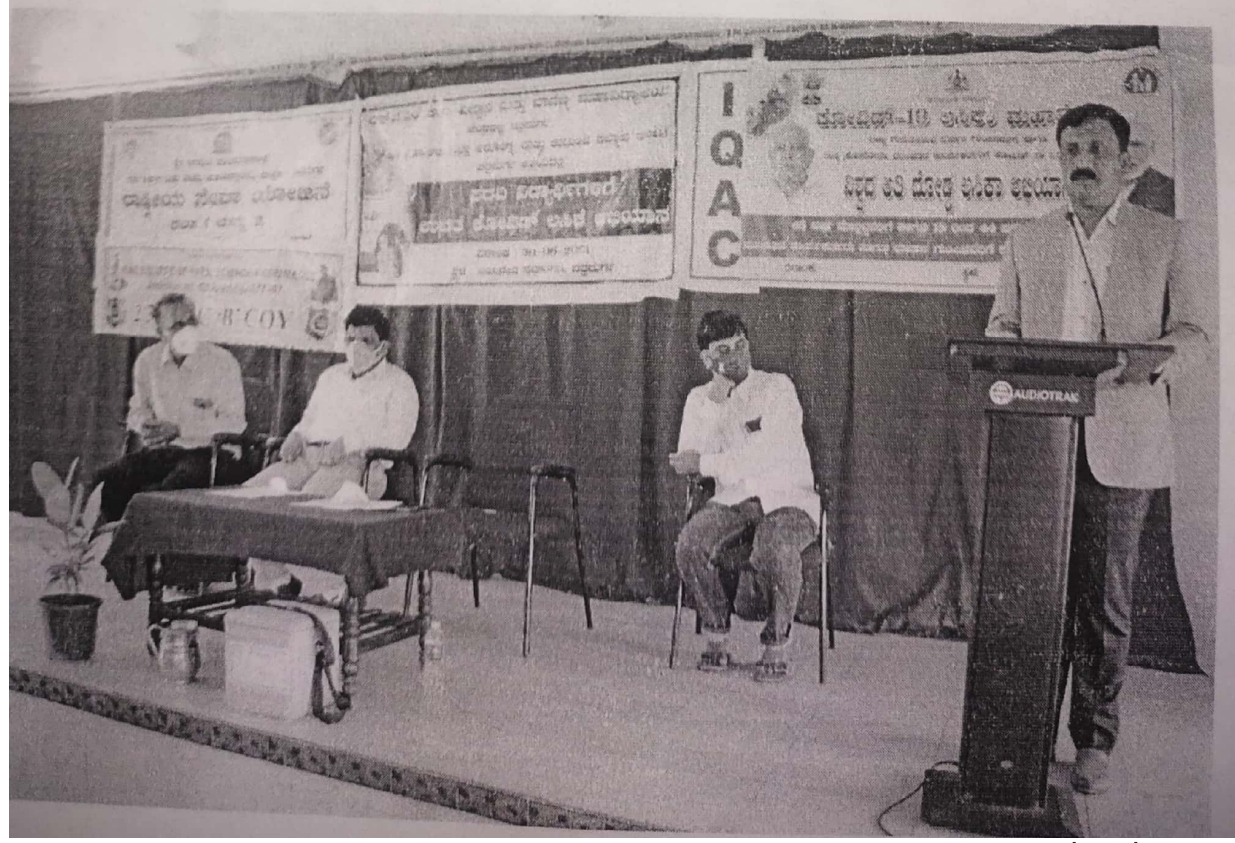
Scanned with CamScanner