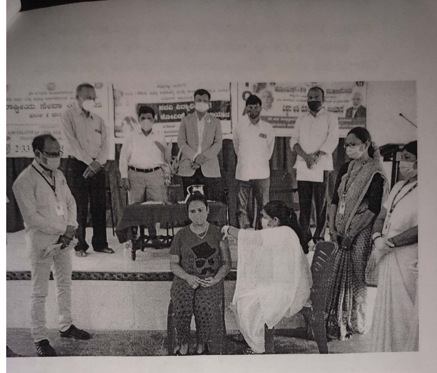
Students and general public are vaccinated Covi-Shield vaccination