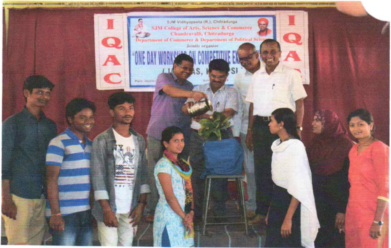
The Principal Address the gathering the function